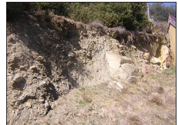
Aflorament de till remobilitzat al Solà d'Engordany

CODI: LLORTS, L'HORTÓ, L'HORTOELL, L'HORTELL